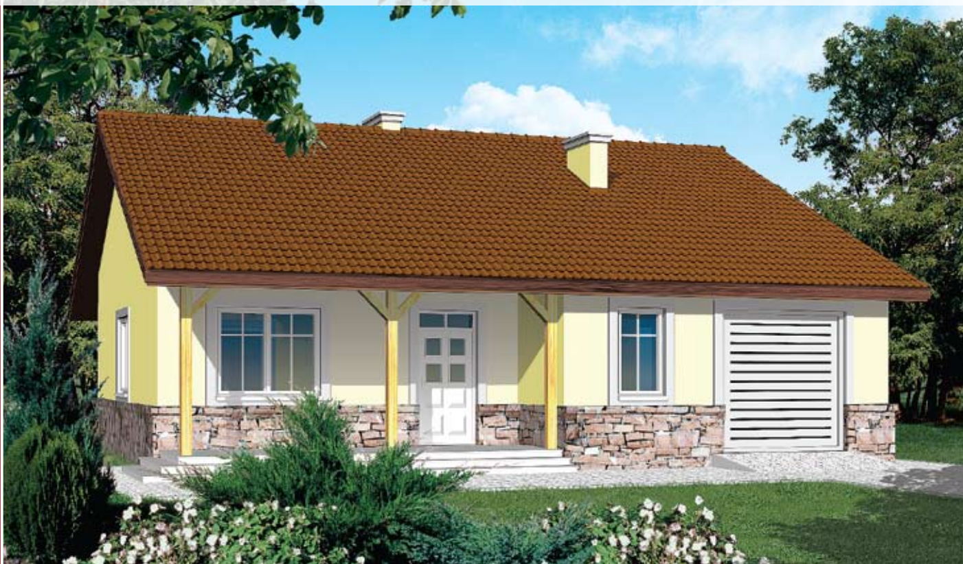
autor: arch. Jarosław Charkiewicz, arch. Tomasz Stryjewski