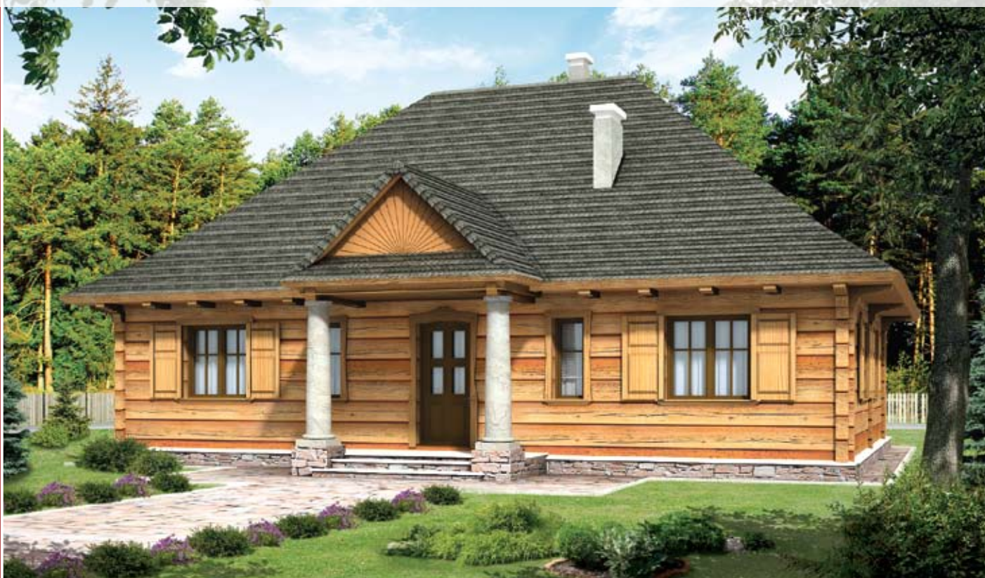
autor: arch. Jarosław Charkiewicz