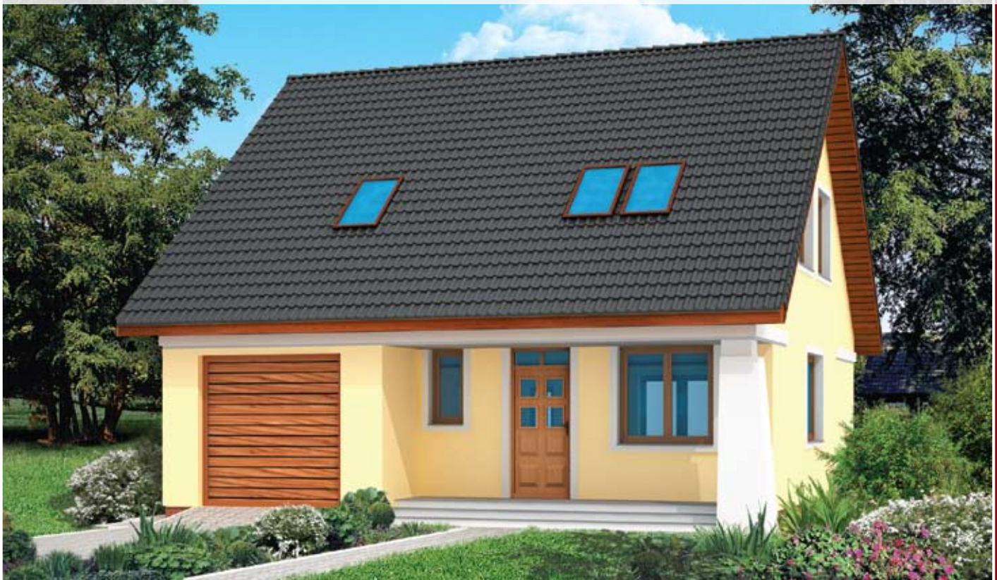
autor: arch. Jarosław Charkiewicz, arch. Tomasz Stryjewski