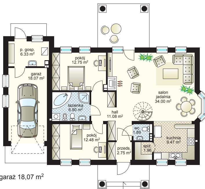
parter: 99,61 m 2 + garaż 18,07 m 2