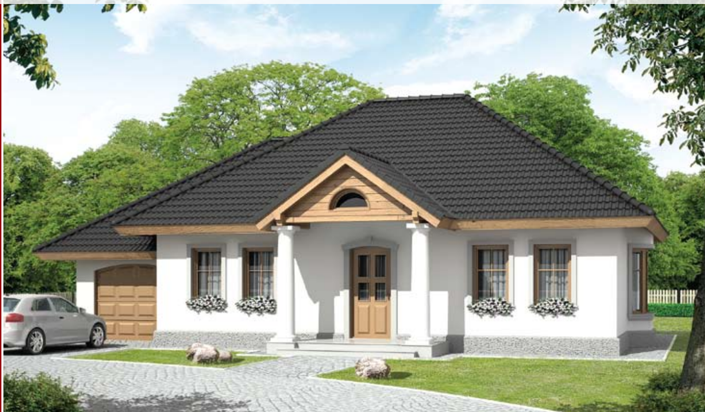
autor: arch. Jarosław Charkiewicz