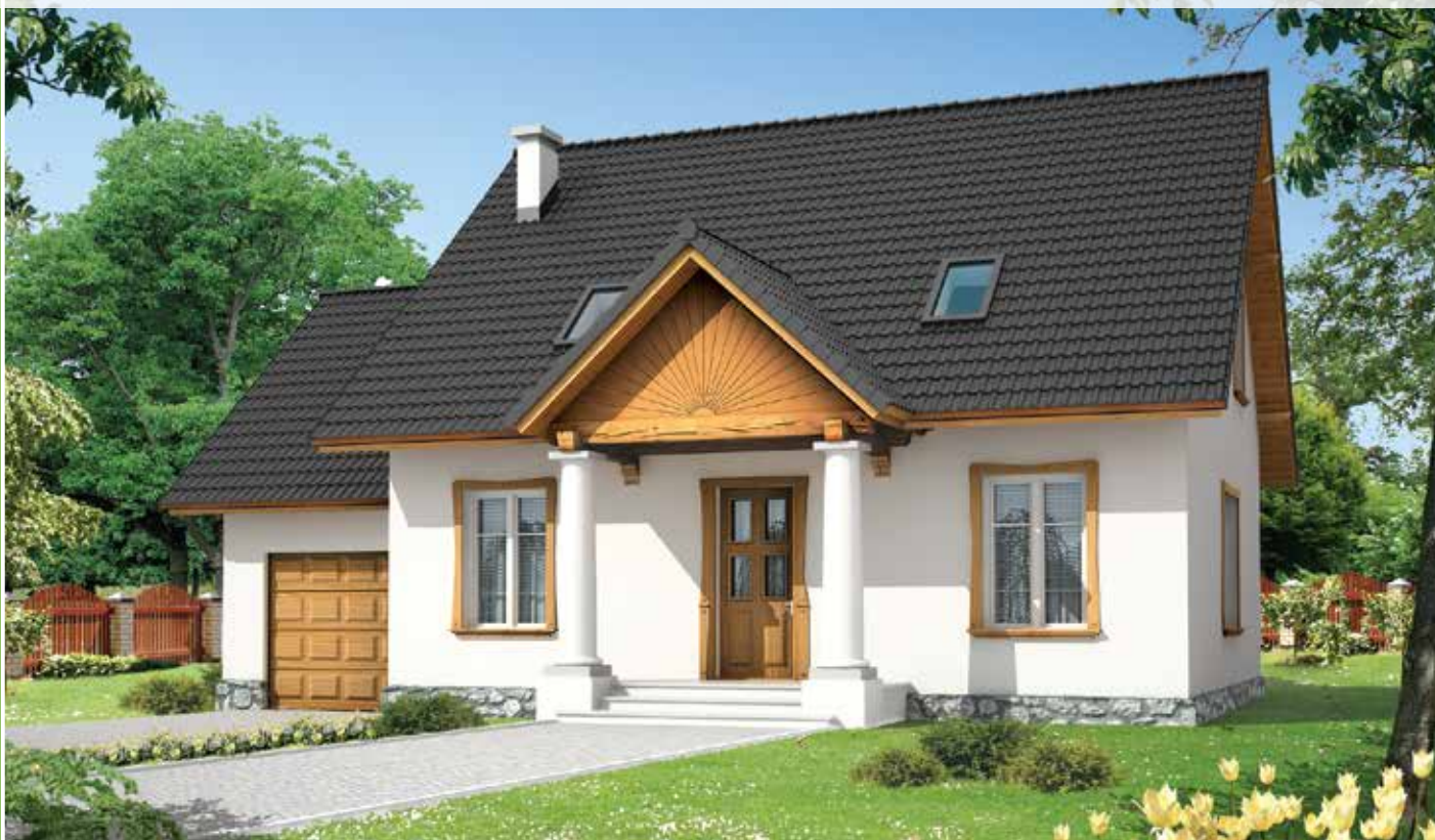
autor: arch. Jarosław Charkiewicz