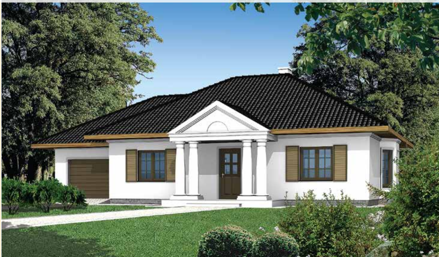
autor: arch. Jarosław Charkiewicz