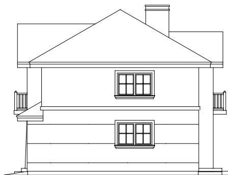
ELEWACJA BOCZNA LEWA