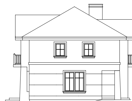
ELEWACJA BOCZNA PRAWA