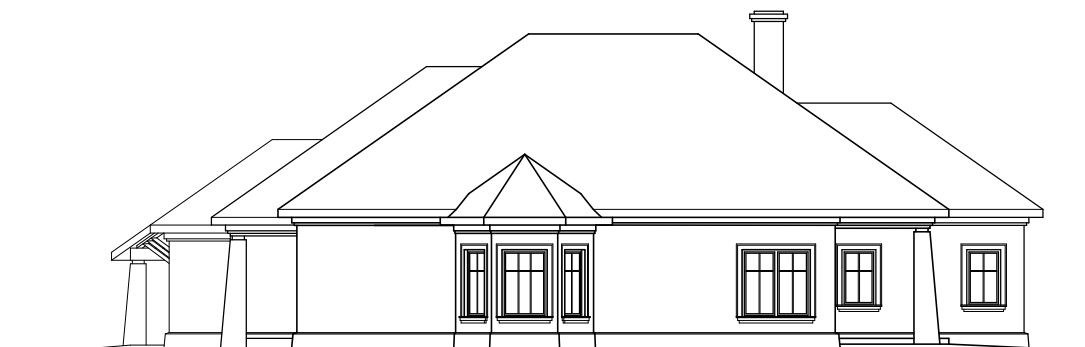
ELEWACJA BOCZNA PRAWA