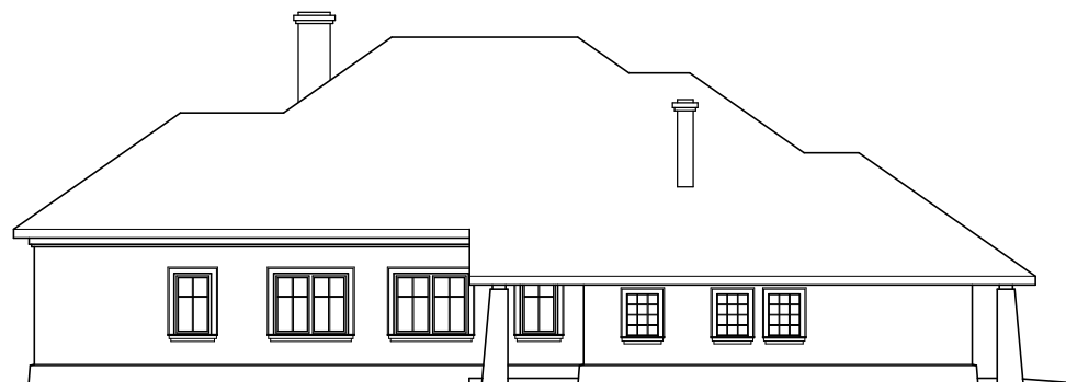
ELEWACJA BOCZNA LEWA